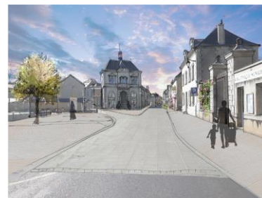
Illustrations : Perspectives rue Albert Pottier