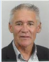
Maire Jérôme HARRAULT